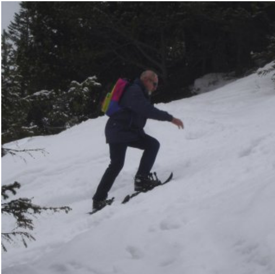
oder im Steilhang