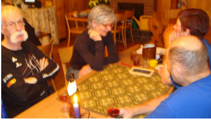
Wer hat die besten Karten..... ???