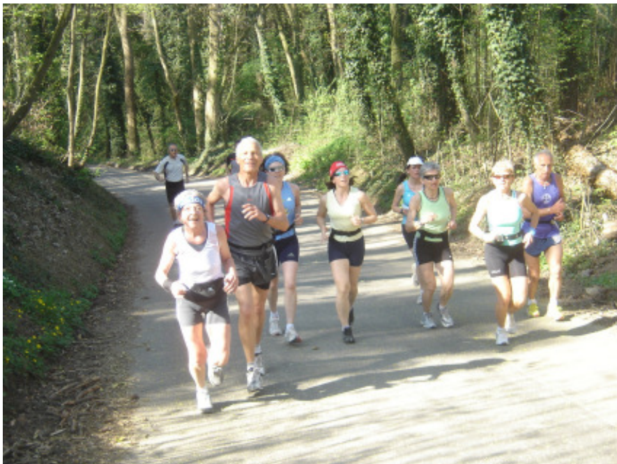
vor dem Maienbühl.....