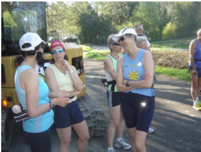
Frauen beim Baggern.....