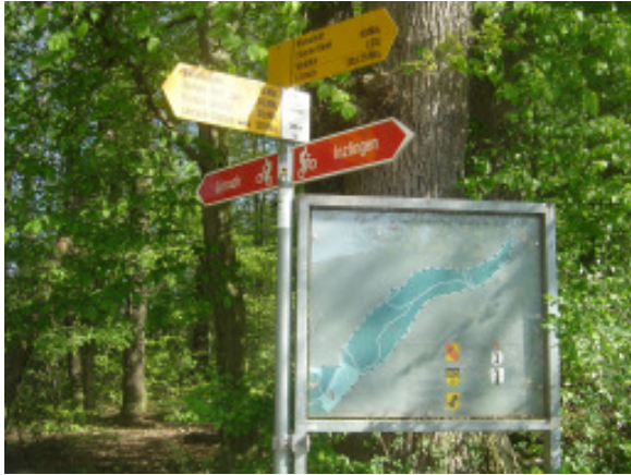
vor der Eisernen Hand.....