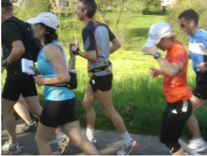
bereits schon der erste Hitzestich.....