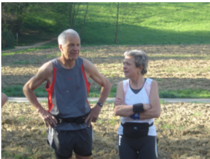
etwas misstrauisch ???