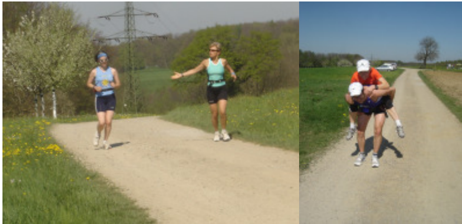
es wurde heiss.....