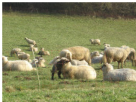
und geselligen Zaungästen....