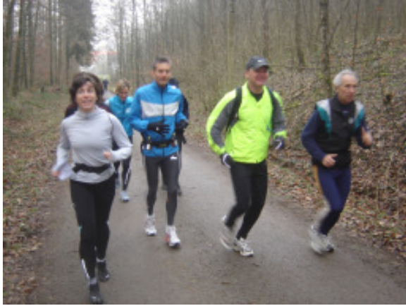
dann ging`s los ...