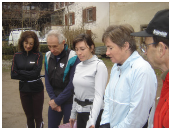
Bedächtigt liessen sich die Teilnehmer in den Long- Jog einführen...