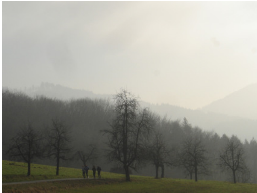
und wunderschöner Landschaft..... Richtung Feuerbach...