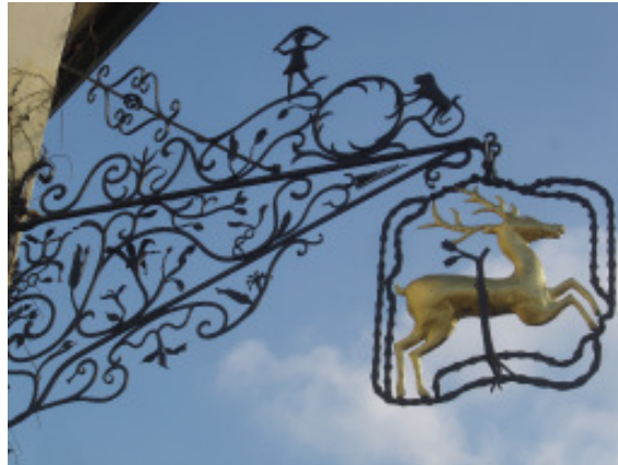
dann ging`s in den Hirschen...