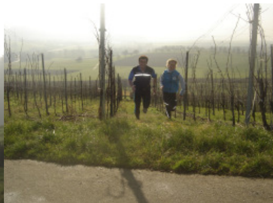
geselliges Joggen mit Rebenintervallen in Tannenkirch...